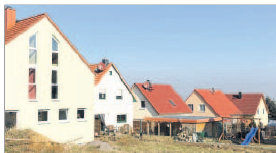
Viele Häuser der Siedlung „Pfirsichgarten“ sind schon bezogen. Keins sieht wie das andere aus.